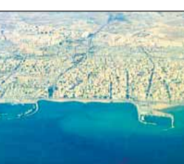
होमरुज जलमरु मध्य

समुद्री मार्गों पर भरोसा बहाल करने के लिए अंतरराष्ट्रीय गठबंधन बनाने का प्रस्ताव