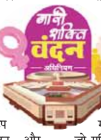
गोपी शक्ति वंदन