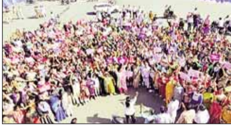
उज्जैन में महिलाओं ने ऐसी मानव शृंखला बनाई

भारत की लोकतांत्रिक व्यवस्था में बड़ा बदलाव लाने की दिशा में सरकार एक अहम कदम उठाने जा रही है। संसद में गुरुवार को एक ऐसा विधेयक पेश किया जाएगा, जिसके