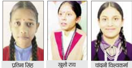
हरिभूमि न्यूज भोपाल

10वीं का 73.42%... और 12वीं का 76.01% परिणाम, सरकारी स्कूल आगे