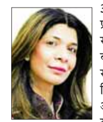
देश की आधी आबादी होने के बावजूद

दरअसल, पूरे समाज का यह सशक्तिकरण यह बिल आने वाली पीढ़ियों के लिए एक सशक्त संदेश है कि बेटियां केवल घर तक सीमित नहीं, बल्कि देश के भविष्य को दिशा देने में भी समान भागीदार हैं। यदि हम सच में 'ए भारत' की कल्पना करते हैं, तो यह कदम उस दिशा में एक मजबूत नींव साबित हो सकता है। अंततः, यह केवल महिलाओं का नहीं, बल्कि पूरे समाज का सशक्तिकरण है।