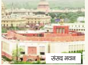
एजेंसी नई दिल्ली

संसद का विशेष सत्र 16 अप्रैल से शुरू होने जा रहा है। 16-17 अप्रैल को लोकसभा और 18 अप्रैल को राज्यसभा में इस पर चर्चा होगी। महिला आरक्षण का भविष्य और सियासत का नया गणित करीब 25-28 घंटे की बहस में तय होगा। जिसमें सरकार साल 2029 से पहले लोकसभा और राज्यों की विधानसभाओं में 33 प्रतिशत महिला आरक्षण लागू करने की तैयारी कर रही है। इसके लिए सरकार 3 बड़े बिल पेश करने वाली है। पहला बिल परिसीमन कानून 2026 से जुड़ा है, दूसरा 131वां संविधान संशोधन बिल है और तीसरा दिल्ली, जम्मू-कश्मीर और पुडुचेरी में महिला आरक्षण लागू करने से संबंधित संशोधन बिल है। 131वां संविधान संशोधन के तहत केंद्र सरकार लोकसभा की मौजूदा 543 सीटों को बढ़ाकर अधिकतम 850 तक करने का प्रस्ताव ला रही है। इन कुल सीटों में से 33 प्रतिशत सीटें महिलाओं के लिए आरक्षित की जाएंगी। यह आरक्षण एक रोटेसन सिस्टम के तहत लागू होगा।