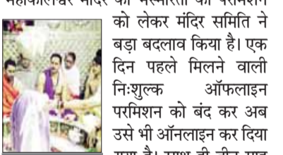
एक दिन पहले खुलेगी बिडो

महाकालेश्वर मंदिर की भस्मरती की परमिशन को लेकर मंदिर समिति ने बड़ा बदलाव किया है। एक दिन पहले मिलने वाली निःशुल्क ऑफलाइन परमिशन को बंद कर अब उसे भी ऑनलाइन कर दिया गया है। साथ ही तीन माह पहले होने वाली भस्मरती की बुकिंग का समय बदलकर उसे एक माह कर दिया है। महाकालेश्वर मंदिर समिति ने भस्मरती परमिशन के नियमों को लेकर बड़े बदलाव किए हैं।