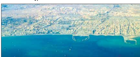
होमरुज जलमरु मध्य

समुद्री मार्गों पर भरोसा बहाल करने के लिए अंतरराष्ट्रीय गठबंधन बनाने का प्रस्ताव