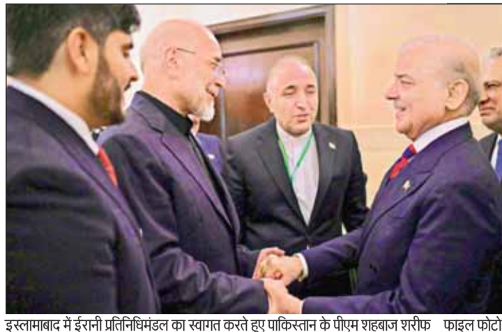
इस्लामाबाद में ईरानी प्रतिनिधिमंडल का स्वागत करते हुए पाकिस्तान के पीएम शहबाज शरीफ फाइल फोटो

ईरान का अमेरिका पर भरोसा नहीं, वो धोखेबाज, हम सैन्य तैयारियों में जुटे