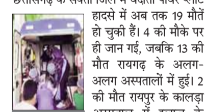
मृतकों में 15 यूपी, बिहार के

छत्तीसगढ़ के सक्ती जिले में वेदांता पावर प्लांट हादसे में अब तक 19 मौतें हो चुकी हैं। 4 की मौके पर ही जान गई, जबकि 13 की मौत रायगढ़ के अलग-अलग अस्पतालों में हुई। 2 की मौत रायपुर के कालड़ा अस्पताल में इलाज के दौरान हुई। प्लांट में मंगलवार दोपहर बांयलर ब्लास्ट हो गया था। मृतकों में 4 छत्तीसगढ़ से हैं, जबकि बाकी 15 यूपी, बिहार, झारखंड और पश्चिम बंगाल से हैं।