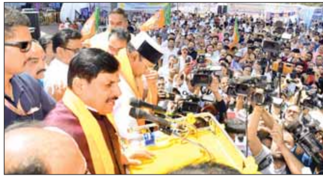
समतामूलक समाज के निर्माण के लिए सबसे अधिकारों की सुरक्षा की भारतीय संविधान की रचना कर इसमें मुख्यमंत्री डॉ. यादव ने बाबा साहेब के

सम्मान में पुष्पांजलि कार्यक्रम में मौजूद सबके समक्ष भारतीय संविधान की मूल उद्देश्यिका का वाचन कर 'डॉ. भीमराव आंबेडकर अमर रहे' के नारे लगाए। उन्होंने कहा कि बाबा साहेब डॉ. आंबेडकर आजीवन वंचितों, पीड़ितों, शोषितों और उपेक्षितों के सामाजिक, आर्थिक, शैक्षिक और राजनैतिक सशक्तिकरण की प्रखर आवाज थे। हमारी सरकार संविधान निमाता बाबा साहेब डॉ. आंबेडकर की समरसता और समानता की भावना को केन्द्र में रखकर लगातार काम कर रही है। बाबा साहेब ने हमें समानता का अधिकार दिलाया और