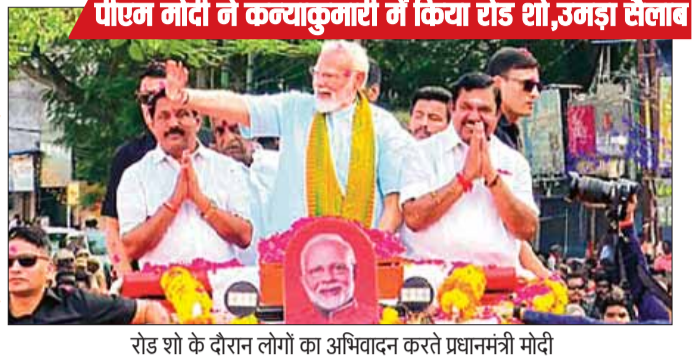
पीएम मोदी ने कन्याकुमारी में किया रोड शो, उमड़ा सैलाब रोड शो के दौरान लोगों का अभिवादन करते प्रधानमंत्री मोदी

पश्चिम बंगाल में विधानसभा चुनाव को लेकर राज्यभर की सियासत में गरमाहट तेज है। राजनीतिक पार्टियों के बीच आरोप-प्रत्यारोप की राजनीति भी सातवें आसमान पर पहुंचती नजर आ रही है। केंद्रीय गृह मंत्री अमित शाह ने बंगाल में चुनावी रैली के दौरान वीडियो संबोधन के माध्यम से टीएमसी सरकार पर जमकर निशाना साधा और बाढ़ राहत के नाम पर 100 करोड़ के घोटाले का आरोप लगाया। उन्होंने आरोप लगाया कि केंद्र से उत्तर बंगाल में बाढ़ राहत के लिए दिए गए 100 करोड़ की रकम में घोटाला हुआ है और सत्ता में आने पर भाजपा यह पैसा वापस लेगी। शाह ने गोरखा मुद्दे पर भी बातचीत की। उन्होंने कहा कि अगर भाजपा बंगाल में सत्ता में आती है, तो दार्जिलिंग के गोरखा मुद्दे को प्राथमिकता से हल किया जाएगा। गोरखा नेताओं और कार्यकर्ताओं पर दर्ज सभी पुराने केस वापस ले लिए जाएंगे।