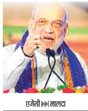
शाह ने 100 करोड़ के घोटाले का आरोप लगाया सारे घोटालों का पैसा भाजपा सरकार लेगी वापस

पश्चिम बंगाल में विधानसभा चुनाव को लेकर राज्यभर की सियासत में गरमाहट तेज है। राजनीतिक पार्टियों के बीच आरोप-प्रत्यारोप की राजनीति भी सातवें आसमान पर पहुंचती नजर आ रही है। केंद्रीय गृह मंत्री अमित शाह ने बंगाल में चुनावी रैली के दौरान वीडियो संबोधन के माध्यम से टीएमसी सरकार पर जमकर निशाना साधा और बाढ़ राहत के नाम पर 100 करोड़ के घोटाले का आरोप लगाया। उन्होंने आरोप लगाया कि केंद्र से उत्तर बंगाल में बाढ़ राहत के लिए दिए गए 100 करोड़ की रकम में घोटाला हुआ है और सत्ता में आने पर भाजपा यह पैसा वापस लेगी। शाह ने गोरखा मुद्दे पर भी बातचीत की। उन्होंने कहा कि अगर भाजपा बंगाल में सत्ता में आती है, तो दार्जिलिंग के गोरखा मुद्दे को प्राथमिकता से हल किया जाएगा। गोरखा नेताओं और कार्यकर्ताओं पर दर्ज सभी पुराने केस वापस ले लिए जाएंगे।