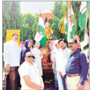
कांग्रेस नेताओं ने बाबा साहेब को किया नमन।