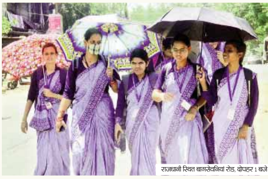
राजधानी स्थित बागसेवकिया रोड, दोपहर 1 बजे

इस वर्ष सीबीएसई 10वीं के परिणाम में रीजन वाइज प्रदर्शन में त्रिवेन्द्रम रीजन ने शानदार प्रदर्शन करते हुए 99.79% पास प्रतिशत के साथ देश में पहला स्थान हासिल किया है। त्रिवेन्द्रम के साथ-साथ विजयवाड़ा ने भी 99.79% पास प्रतिशत हासिल किया, जबकि चेन्नई 99.58% के साथ तीसरे स्थान पर रहा। इसके बाद बेंगलुरु ने 98.91% और दिल्ली वेस्ट ने 97.45% प्रतिशत के साथ टॉप 5 रीजन में अपनी जगह बनाई।