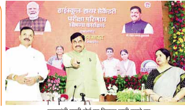
मुख्यमंत्री एमपी बोर्ड का रिजल्ट जारी करते हुए