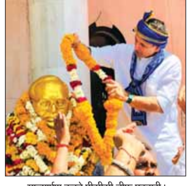
माल्यार्पण करते पीसीसी चीफ पटवारी।