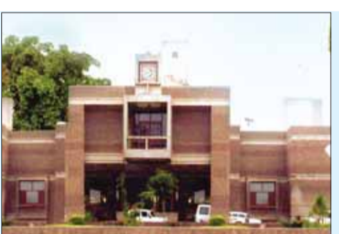
महत्वपूर्ण पद खाली, व्यवस्था पर असर

हरिभूमि, जबलपुर। मध्य प्रदेश के बिजली विभाग में प्रशासनिक अव्यवस्था और अधिकारियों की निरंकुश कार्यशैली का गंभीर मामला सामने आया है। छह माह का अनिवार्य प्रशिक्षण पूरा करने के बावजूद हजारों अभ्यर्थियों को अब तक फील्ड पर नियुक्त नहीं मिल पाई है। स्थिति यह है कि विभागीय स्तर पर जिम्मेदार अधिकारियों की उदासीनता के कारण पूरी नियुक्ति प्रक्रिया ठप पड़ी हुई है, जबकि प्रशिक्षित युवा अपने हक के लिए दर-दर भटकने को मजबूर हैं। सूत्रों के अनुसार इस पूरे मामले की जड़ अधीक्षण अभियंताओं की लापरवाही और मनमानी है। सेंट्रल ट्रेनिंग इंस्टीट्यूट (सीटीआई) को समय पर जरूरी जानकारी और रिपोर्ट नहीं भेजी गई, जबकि मानव संसाधन विभाग ने स्पष्ट निर्देश जारी कर हर माह रोटेशनल ट्रेनिंग सुनिश्चित करने की जिम्मेदारी इन्हीं अधिकारियों को सौंपी थी। आदेशों की खुली अनदेखी करते हुए न तो समय पर रिपोर्टिंग की गई और न ही ट्रेनिंग शेड्यूल का पालन हुआ। इसका सीधा असर नियुक्ति प्रक्रिया पर पड़ा, जो अब पूरी तरह बाधित हो चुकी है।