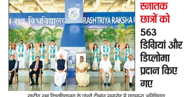
राष्ट्रीय रक्षा विश्वविद्यालय के पांचवें दीक्षांत समारोह में गणमान्य अतिथिगण

राष्ट्र की सेवा के पांच गौरवशाली वर्ष पूरे करने वाले राष्ट्रीय रक्षा विश्वविद्यालय (आरआरयू) ने गुजरात के गांधीनगर के लावाद परिसर में अपना पांचवां दीक्षांत समारोह आयोजित किया गया। इस अवसर पर मुख्य अतिथि राष्ट्रपति श्रीमती द्रौपदी मुर्मू ने आरआरयू को भारत के नागरिक-सैन्य शैक्षणिक दृष्टिकोण का प्रतीक एक अनूठा संस्थान बताया और राष्ट्रीय सेवा के प्रति समर्पण के लिए इसके संकाय और नेतृत्व की सराहना की। उन्होंने कहा कि भारत की सुरक्षा केवल एक सेवा या सिद्धांत से नहीं, बल्कि एक एकीकृत राष्ट्रीय प्रयास से कायम है। उन्होंने साइबरस्पेस, रक्षा प्रौद्योगिकी, डेटा सिस्टम, न्याय व्यवस्था और समुद्री जागरूकता सहित सुरक्षा के बदलते स्वरूप पर प्रकाश डाला और छात्रों से अनुशासन, विनम्रता और नैतिक स्पष्टता को लोक सेवा के आदर्शों के रूप में अपनाने का आग्रह किया।