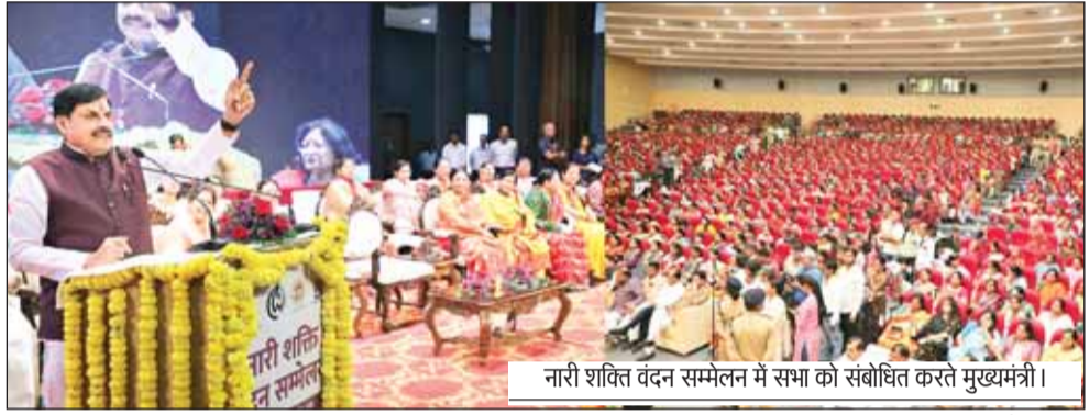
नारी शक्ति वंदन सम्मेलन में सभा को संबोधित करते मुख्यमंत्री।

मुख्यमंत्री डॉ. मोहन यादव ने कहा कि वर्ष 2047 में भारत को विकसित राष्ट्र बनाना है। महिलाओं के हित में लगातार निर्णय लेकर महिलाओं को अधिकार देने के साथ उन्हें सशक्त बना रहे हैं। मुख्यमंत्री ने कहा कि डॉ. आंबेडकर की पहल को आगे बढ़ाते हुए प्रधानमंत्री मोदी ने नारी शक्ति को लोकसभा और विधानसभाओं में 33 प्रतिशत आरक्षण दिलवाने का संकल्प लिया है। यह 21 वीं शताब्दी का सबसे बड़ा निर्णय है। इस अधिनियम के लागू होने के बाद नारी शक्ति का तेजी से सशक्तिकरण होगा। मुख्यमंत्री डॉ. यादव मंगलवार को इंदौर के परस्पर नगर स्थित लता मंगेशकर ऑडिटोरियम में आयोजित नारी शक्ति वंदन सम्मेलन को संबोधित कर रहे थे। उन्होंने कहा कि प्रधानमंत्री ने सुप्रीम कोर्ट के निर्णयों का पालन करते हुए मुस्लिम महिलाओं को तीन तलाक से मुक्ति दिलाकर उनके हित में नया इतिहास लिखा, तो वहीं अयोध्या में भगवान श्रीराम का भव्य मंदिर बनाया। मुख्यमंत्री ने कहा कि इंदौर देवी अहिल्याबाई का शहर है, और स्वर कोकिला लता मंगेशकर की जन्मस्थली है। आज हम जिस सभागृह में उपस्थित हैं वह लता मंगेशकर की स्मृति में बनाया गया है।